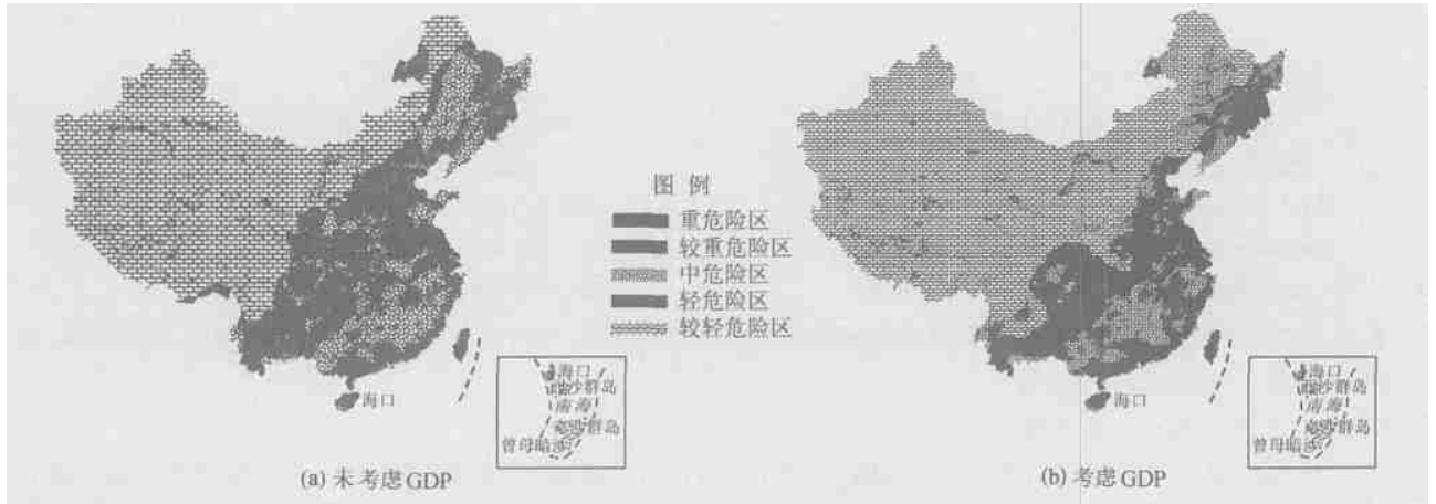
图 1 中国洪水灾害危险程度区划

根据专家的意见,将洪水灾害危险程度区划由原来的八级改为五级,即重危险区(1级),较重危险区(2级),中危险区(3级),轻危险区(4级),极轻危险区(5级),见图 1(a).将全国 GDP 的密度分布图与图 1(a)叠加,见图 1(b).对图 1(a)和图 1(b)进行统计比较(表 2)发现,考虑 GDP 后洪水灾害的危险程度分布比例有明显改变,主要表现在:极轻危险区和重危险区比例加大,其他危险区比例减小.重危险区主要分布在经济比较发达的华东、华南地区.